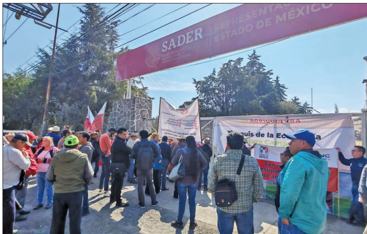
▲ Los manifestantes fueron recibidos, pero se les advirtió que no había titulares en las oficinas.

“Si eso están haciendo con siete estados de la República, todos los demás corremos el riesgo que nos