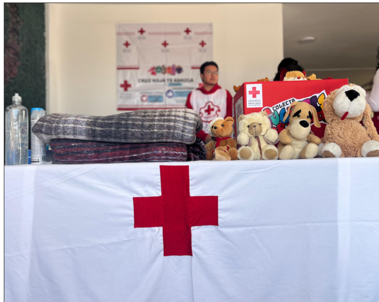
▲ A través de la campaña Cobijando Almas, la Cruz Roja mexicana, delegación Estado de México, invita a la población a donar e intercambiar prendas abrigadoras.

Las donaciones se recibirán en un horario de 7:00 a 20:00 horas, todos los días.