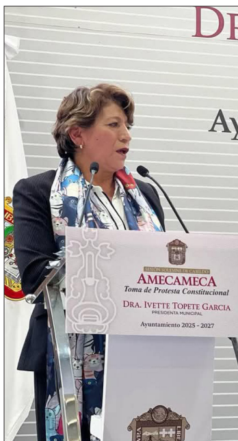
▲ La gobernadora Delfina Gómez recordó a la alcaldesa la importancia de ser “una servidora pública a la altura de la confianza de los ciudadanos”.

Exhortó a la alcaldesa a seleccionar cuidadosamente a su equipo de colaboradores “cuando tenemos un buen equipo todo puede resultar bien pero si también tenemos un mal elemento no dudemos en quitarlo del equipo porque un elemento nos puede perjudicar en un proyecto de trabajo en beneficio de la población”, expresó.