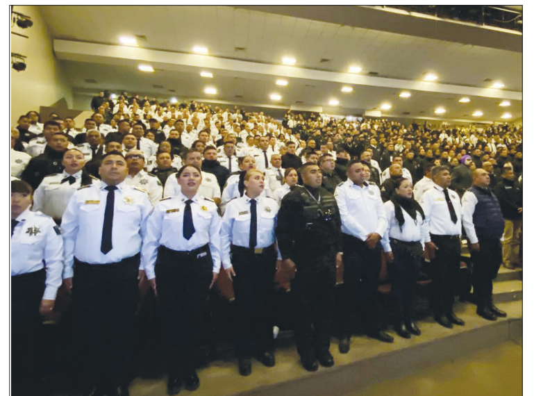
El cuerpo policiaco de Nezahualcóyotl fue distinguido por prácticas que benefician a la población; mientras que 25 elementos fueron dados de baja.

“Más allá de lo que la Encuesta Nacional de Seguridad Urbana nos diga, estamos generando mecanismos de identificación ciudadana para tener un diagnóstico de qué debemos de seguir haciendo y ajustando en cada cuadrante”, puntualizó.