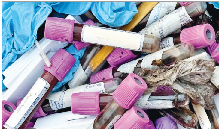
▲ Bolsas con muestras de sangre, guantes y otros desechos biológico-infecciosos son dispuestas de forma inadecuada en el parque.

Los vecinos señalaron en el documento que entregaron con sus rúbricas que el 24 de septiembre de este año se percataron de la aparición de bolsas de basura con residuos peligrosos biológicos infecciosos (RPBI) en una área verde, donde se encuentran montones de mulch y palmas que había dejado el