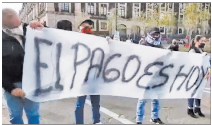
◀ Los adeudos a trabajadores y extrabajadores municipales crece en la entidad.

dentes laborales, acoso laboral, no pago de utilidades, condiciones de trabajo inseguras, incumplimiento de contrato, discriminación y represalias.