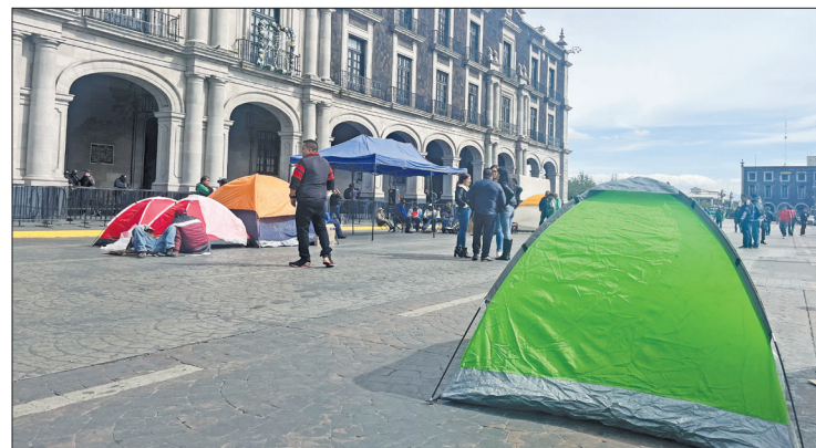
▲ Trabajadores de Ecatepec mantienen cerradas las vialidades que conectan el municipio con la CDMX, así como un plantón en el Palacio de Gobierno estatal.