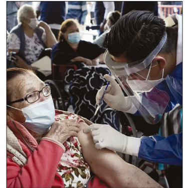
▲ Durante 2024, el DIFEM brindó asistencia médica a más de 80 mil adultos mayores, para dignificar la calidad de vida e inclusión de este grupo social.

A estas acciones, se suma la entrega de más de ocho mil ayudas técnicas y aparatos auditivos como resultado de 19 eventos regionales y 20 jornadas médicas de audiometría, en las que se realizaron dos mil