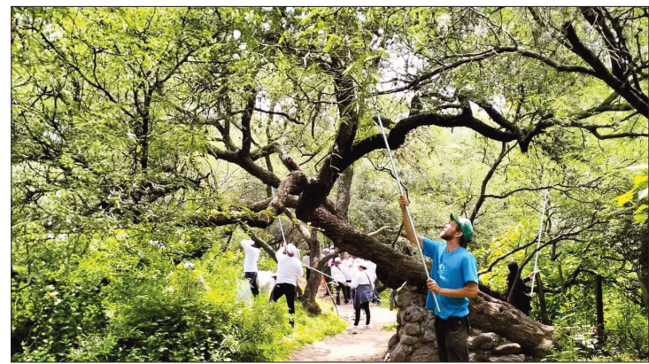
▲ La plaga ha crecido debido, en particular, a la presencia de heces de perro, además de la expansión de la mancha urbana.

Entrevistados ambientalistas, destacaron que la zona desde hace más de 30 años ha sufrido cambios de uso del suelo, por su cercanía con zonas urbanas e industriales.