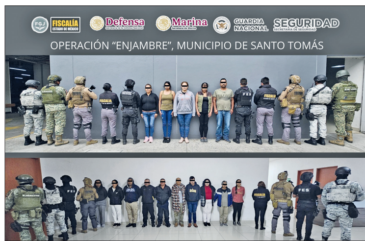
▲ Faltan 11 órdenes de aprehensión por cumplimentar, relacionadas con diferentes delitos entre los que se encuentran la extorsión, cohecho y lesiones

Entre las personas detenidas hay tres integrantes del ayuntamiento y cinco son familiares de la pareja de ediles