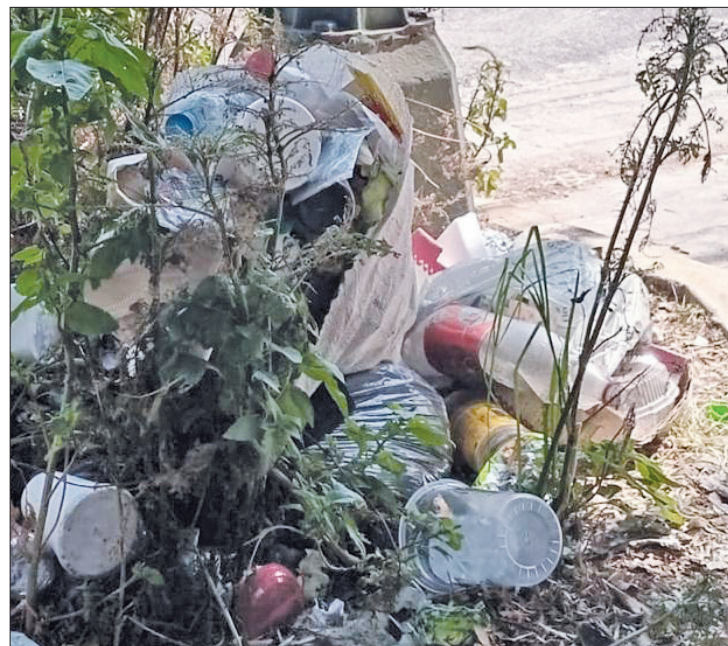
▲ Las calles de Naucalpan se han convertido en tiraderos improvisados ante la falta del servicio de recolección.

Por ello, los vecinos consideran que lo más adecuado es pedir la intervención de las autoridades para evitar mayores daños al medio ambiente y la salud pública.