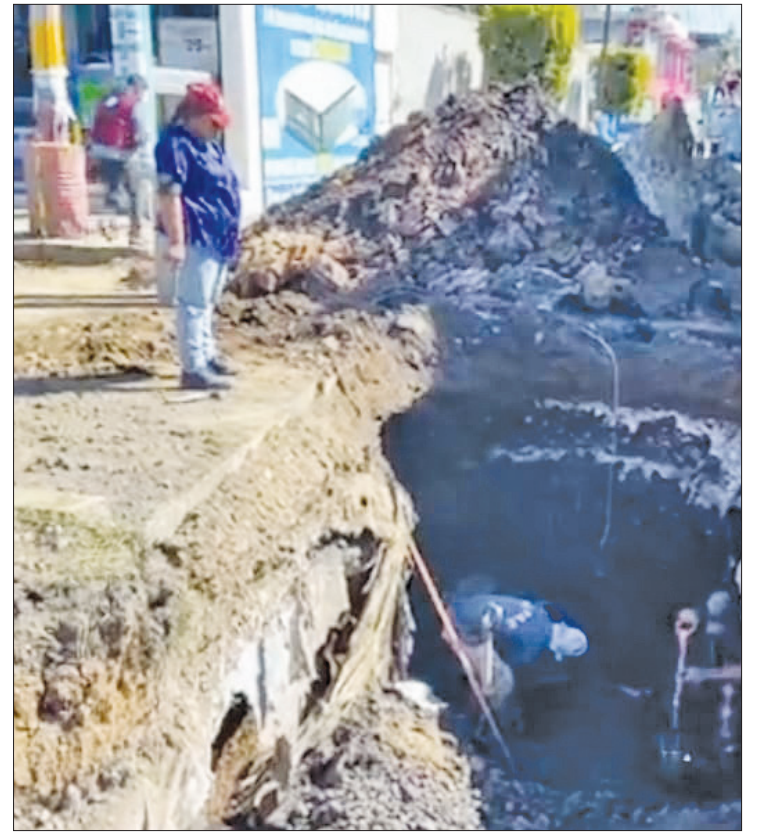
▲ En 2024 se detectaron, al menos, 50 socavones en el Valle de Chalco.

Hasta el momento, el gobierno de Ecatepec, que está por concluir su periodo administrativo, no ha emitido algún comunicado al respecto.