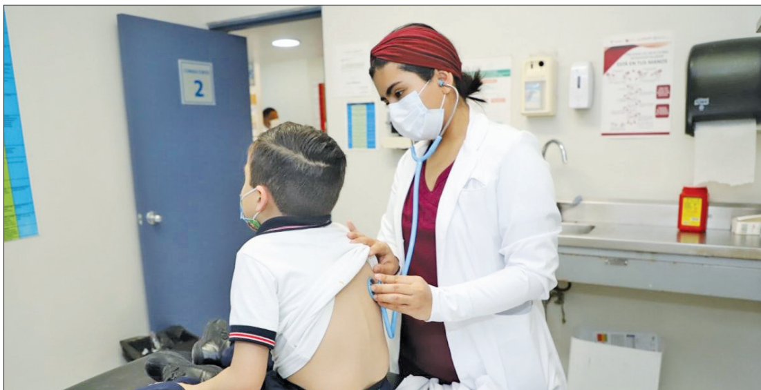
▲ En el Estado de México se incrementaron las Infecciones Respiratorias Agudas que afectan sobretudo a las mujeres, la mayoría son de tipo viral.

Se incrementó el personal médico especializado, para fortalecer las tareas de atención y prevención en los 75 hospitales que forman parte de este nuevo esquema.