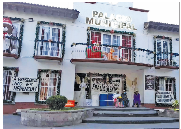
▲ El Palacio Municipal de Luvianos, con las pancartas de los manifestantes instaladas al frente, es vigilado por algunos pobladores.

Por estos hechos, elementos de la Policía Estatal y del municipio se desplazaron para resguardar el inmueble y garantizar el orden en el ayuntamiento de Temoaya.