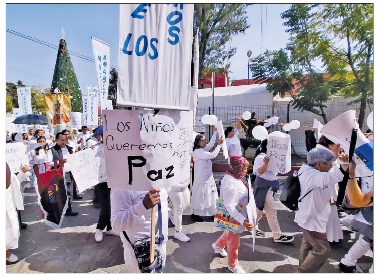
▲ Los habitantes de Teotihuacán pidieron por la paz, armonía y seguridad de México y el mundo.