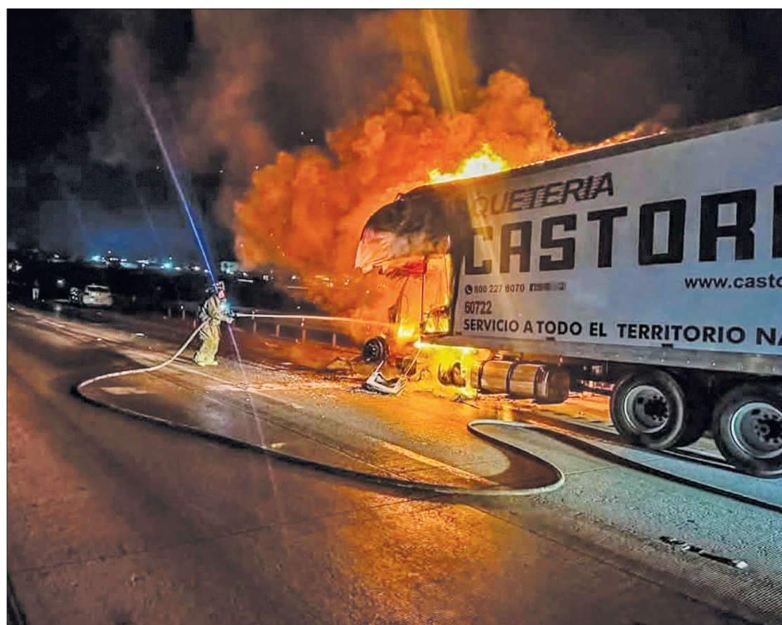
▲ Un tráiler de la empresa de transportes Castores se incendió la mañana del primer día de 2025 sobre la autopista México-Querétaro, a altura de San Juan del Río, lo que provocó una fuerte movilización de los cuerpos de emergencia. Protección Civil y Guardia Nacional reportaron

La Fiscalía General de Justicia ya realiza las investigaciones correspondientes para deslindar responsabilidades.