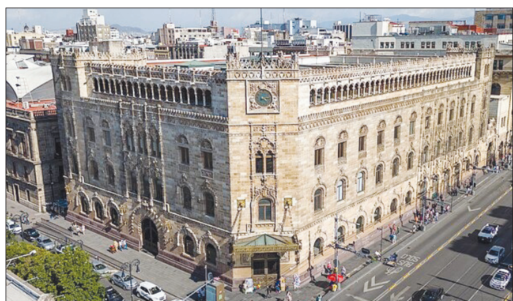
◀ El palacio postal sigue funcionando como oficina de correos, el cual guarda exquisitas obras de arte, relojería e ingeniería.

El edificio postal, joya de la arquitectura en CDMX, tendrá un taller especial para escribir las cartas de los pequeños, aunque las misivas pueden ser enviadas desde cualquier oficina postal del país