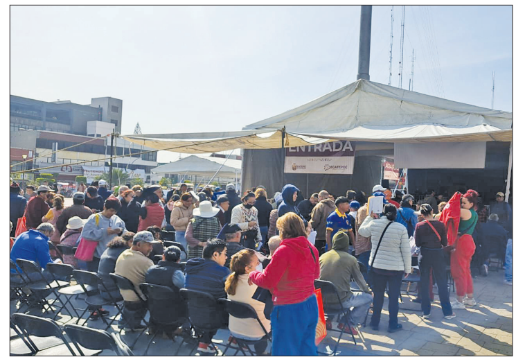
▲ En Ecatepec se puso en marcha el programa Borrón y Cuenta Nueva para apoyar a contribuyentes morosos en el pago de agua.

“Ningún bien o servicio que contrate el ayuntamiento puede resultar al mismo precio o más caro de como lo han contratado administraciones pasadas, tenemos que contratar más barato, eficientar el presupuesto, estirarlo para que tengamos mejores servicios y mayor disponibilidad de recursos para los ciudadanos”.