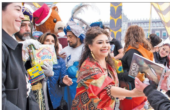
◀ Clara Brugada entregó 15 mil juguetes lúdicos en el Centro Histórico, donde se partió una rosca de 400 metros de longitud.

La jefa de Gobierno comparte el tradicional pan en un acto en el Zócalo capitalino; llama a dar obsequios que rompan los estereotipos de género y que fomenten la paz y la educación