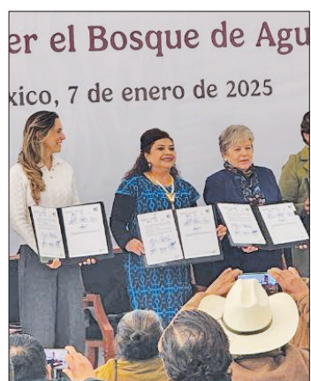
er el Bosque de Agua xico, 7 de enero de 2025

Clara Brugada destaca el combate a la tala clandestina; Delfina Gómez propone declararlo área natural protegida federal