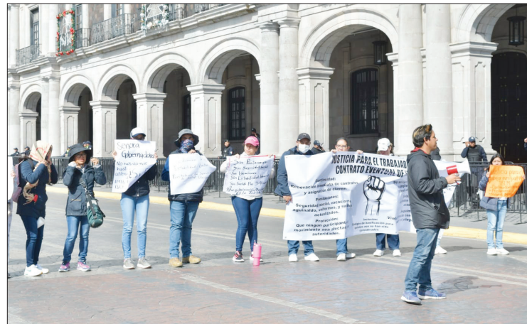
▲ En medio de consignas, el personal del ISEM exigió plazas en el sistema de salud y no afectar a quienes participaron en las manifestaciones.

Explicaron que la falta de contratos afecta a los trabajadores, ya que no son respaldados por la Ley, lo que genera inseguridad económica; ausencia de beneficios sociales como aguinaldo, vacaciones pagadas, prima vacacional, seguro médico o pensiones e incertidumbre