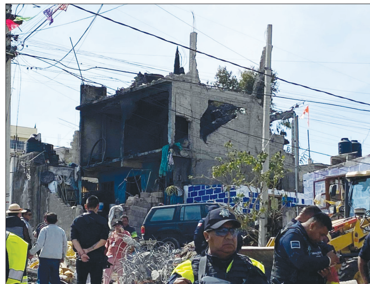
▲ El caso más reciente fue la explosión en una zona habitacional de Chimalhuacán usada, presuntamente, como bodega de pirotecnia.

En Tepetlixpa se contabilizó el mayor número de víctimas el año pasado por la explosión de cohetes trasladados en una camioneta; fueron 16 lesionados y una persona fallecida. Además, un total de 25 inmuebles presen-