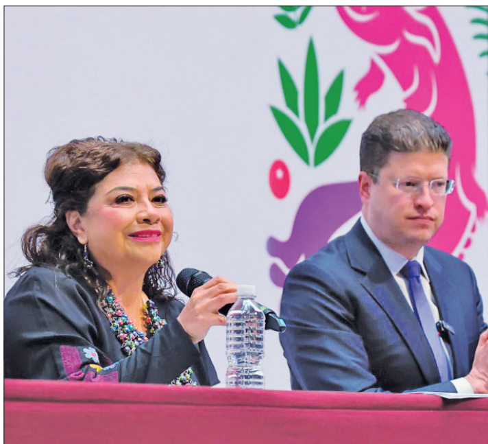
▲ La jefa de Gobierno de la CDMX, Clara Brugada, señaló que tienen el compromiso de duplicar el número de videocámaras en las zonas de alta incidencia.

“Tenemos el gran compromiso de duplicar el número de videocá-