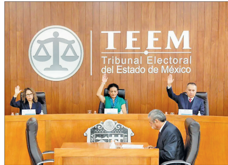
▲ El Tribunal Electoral del Estado de México anunció que espera la designación de presupuesto para las elecciones de junio, pero trabajará con la estructura existente.

La magistrada presidenta afirmó que están capacitados para llevar a cabo el proceso electoral inédito en materia judicial.