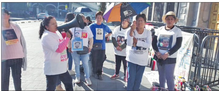
▲ Integrantes del colectivo Haz valer mi libertad lograron que se les abra una cita para la revisión de los casos de sus familiares detenidos.