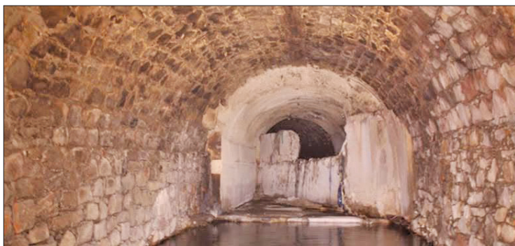
▲ El Río Verdiguél se encuentra embovedado solo en algunos tramos del norte de la capital del estado