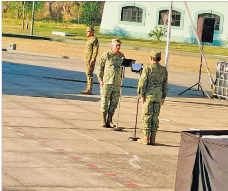
▲ El relevo de los mandos se llevó a cabo en la explanada de la Zona Militar de Tejupilco, en una ceremonia en la que estuvo presente la gobernadora.

Mantener la paz y la seguridad de la población, por lo que puede