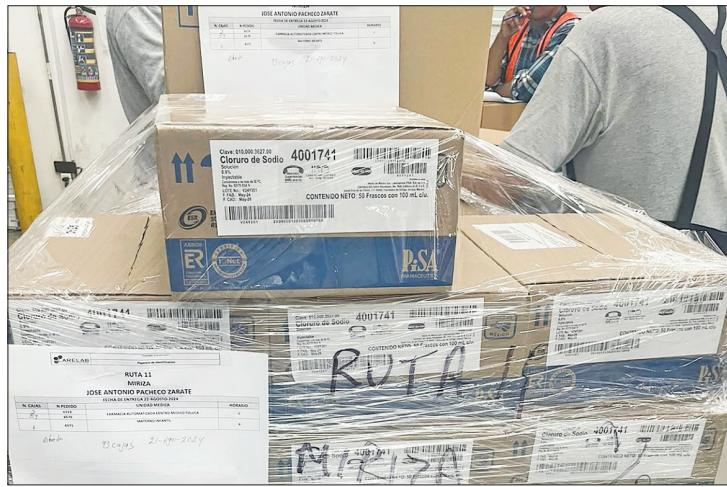
◀ En la reunión, se habló sobre el abasto de medicamentos al instituto, aseguran que comenzarán su distribución en la segunda quincena de febrero

Tras marchas de pensionados, representantes del instituto y una comisión de los derechohabientes entablaron diálogos en torno a las demandas de los manifestantes