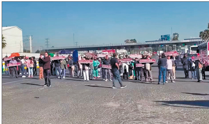
▲ Marcharon vecinos de Fimesa y bloquearon de nuevo las avenidas. Anunciaron que por la falta de atención del Gobierno estatal, planean presentarse en la Mañanera del Pueblo

Indicaron que esta movilización se debió a que el director de Gobierno Regional los ha abandonado, pues tenían una mesa de diálogo para firmar una minuta, pero no se han reunido con ellos.