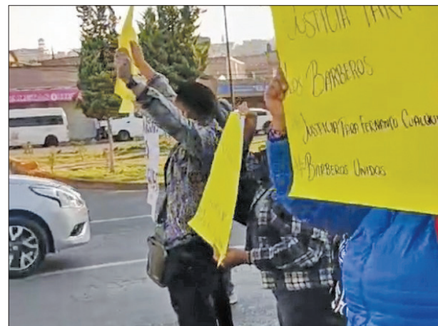
▲ Los figaros mexiquenses protestaron en diversas partes del estado contra el cierre de sus locales; acusan arbitrariedad del operativo Atarraya . Foto Emilio Varela / Especial

DE PALACIO DE GOBIERNO AL ZÓCALO DE LA CDMX