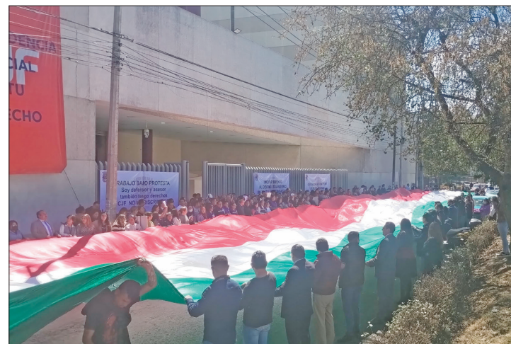
▲ De manera arbitraria y sin previo aviso se les disminuyó las aportaciones.

Explicó que el Consejo de la Judicatura está obligado a aportar 10% del salario del trabajador para su